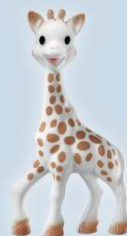
Sophie la girafe®