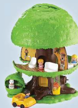
L'arbre magique des Klorofil®